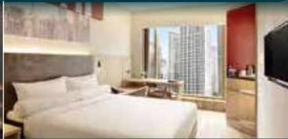
(吉隆坡) 4★吉隆坡市中心宜必思酒店 Hotel Ibis KLCC