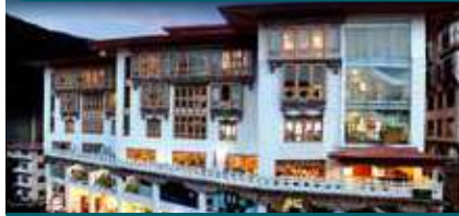
(廷布) 4★廷布城市酒店 City Hotel Thimphu