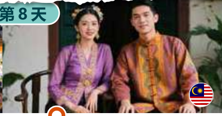
娘惹峇峇服飾體驗