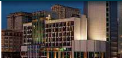
(吉隆坡) 4★布城帝盛酒店 Dorsett Putrajaya