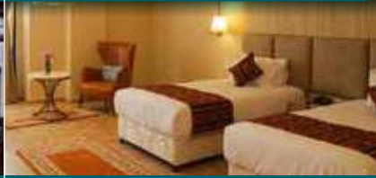
(帕羅) 4★卡奇大酒店 Hotel Kaachi Grand