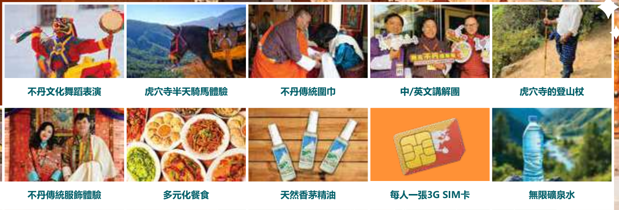
不丹文化舞蹈表演